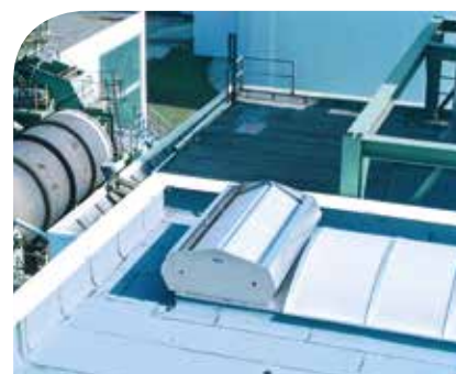
Mehrzweck-Abluftsystem in einer Zuckerfabrik