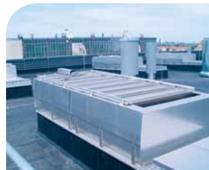
Schallgedämmte Entlüftung eines Müllbunkers