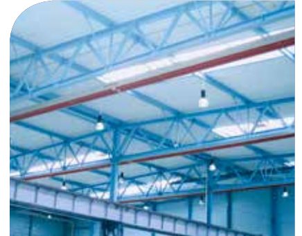
Flächendeckende Wärmebänder in einer Montagehalle