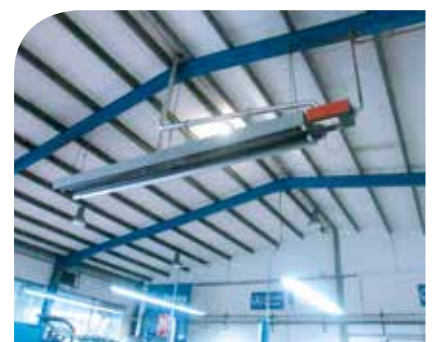
Dezentrale Arbeitsplatzbeheizung durch Dunkelstrahler