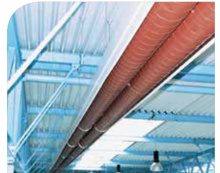
Strahlungsband-Heizband in einer Lagerhalle