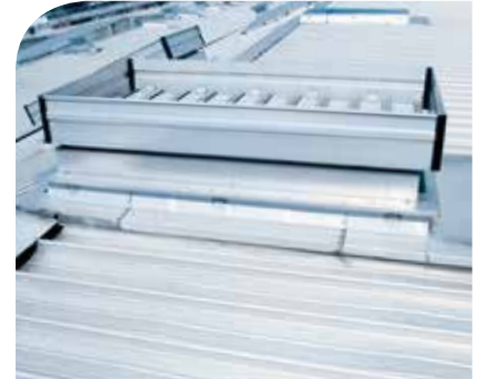
NRA-Systeme auf einem Kalzip-Dach