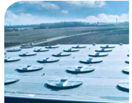
Architektonische NRA-Systeme auf einem Integrationszentrum