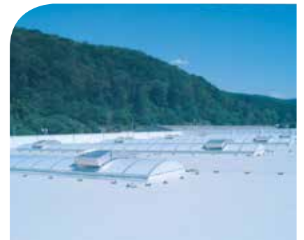
Lichtstraße in Verbindung mit gebogenen NRA-Jalousien