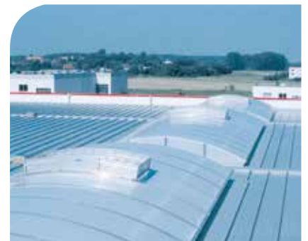
Entrauchungssystem über einer Fahrstraße