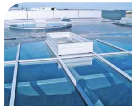
NRA-System in Rundglasoberlicht integriert